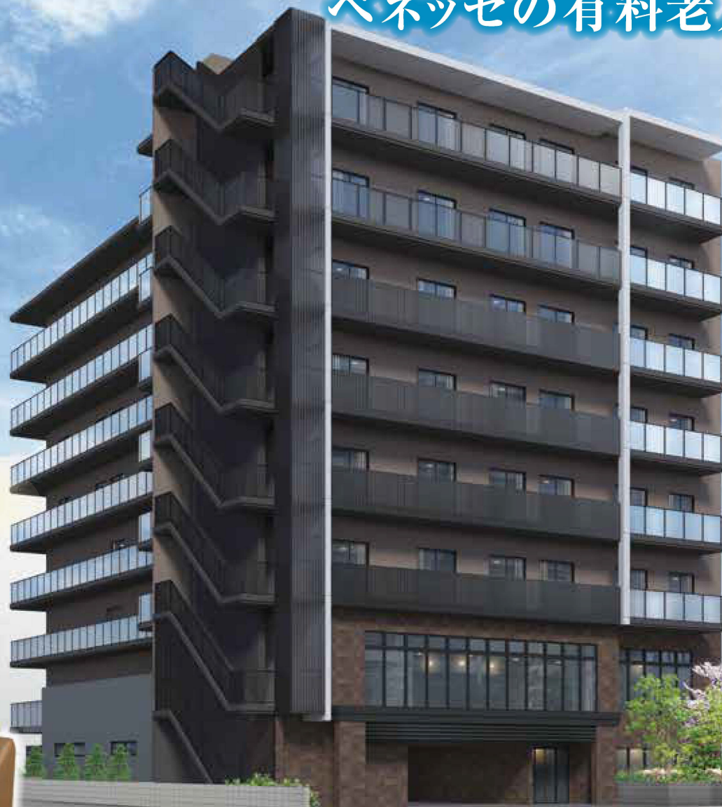
リハビリホームグランダ池田満寿美町/外観 (完成予想CG) 土地建物の所有形態:事業主体非所有

完成したばかりのホームをじっくりと内覧いただけます。 心地よさに包まれた住空間を、ぜひご覧ください。