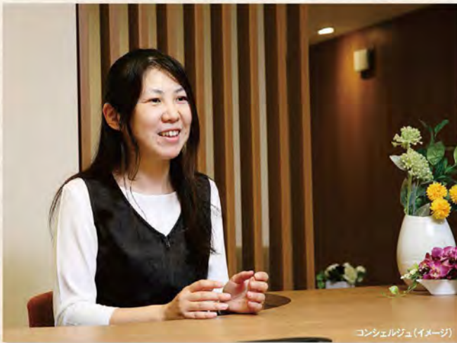
コンシェルジュ(イメージ)