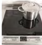
IHクッキングヒーター

火事の心配がない、安全・安心のIHクッキングヒーター。2口コンロでお料理しやすく、お手入れも簡単です。