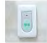
浴室緊急通報ボタン