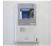
居室内ハンズフリーインターホン