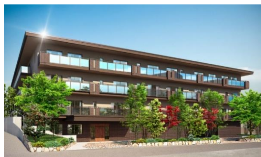
メディカルホームグランダ高宮外観完成イメージ図