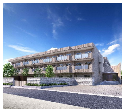
グランダ小石川／外観（完成予想 CG） [土地建物の所有形態：事業主体非所有]

『グランダ小石川』では、ベネッセが 30 年以上にわたり培ってきた介護事業運営の経験と、多くのご入居者様・ご家族様から教えていただいた学びをもとに、地域にお住まいの皆様にとって心地よい住まいとは何か、より良い人生をお過ごしいただくためにどのようなことができるかを常に考えてまいります。そして、ご入居者様お一人おひとりの「その方らしさに、深く寄りそう。」ことを大切に、サービスをご提供してまいります。